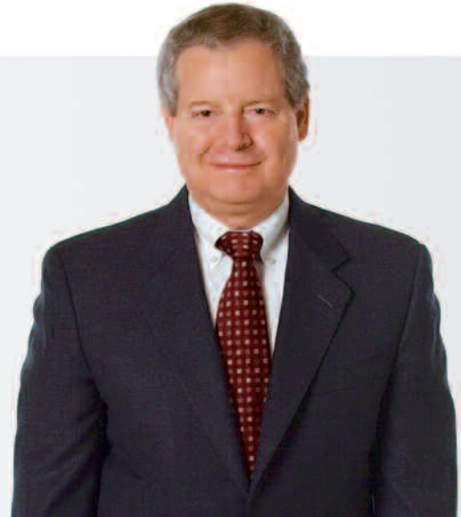
Дж. Дж. Малва, президент и главный исполнительный директор